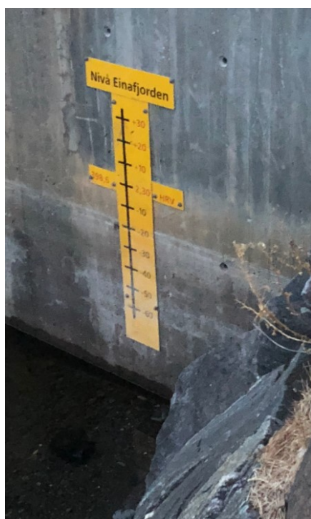
Nivå merket ved Eina sentrum 3 august 2018

Vi har også i år holdt kontakt med regulanten Vokks for å prøve og påvirke deres arbeid med reguleringen. Vi har hatt møter sammen med Vokks og Vestre Toten kommune om reguleringen i år, et møte i mars 2018 og et nå i år (mars 2019). Reguleringskurver for 2018 legges frem i eget vedlegg på møte.